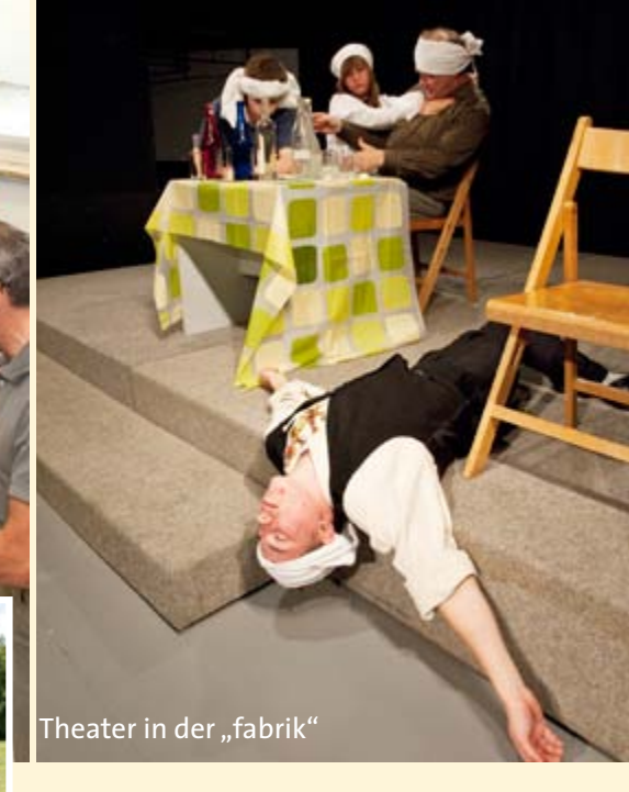
Theater in der „fabrik“