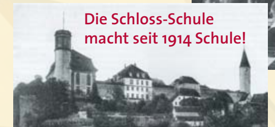
Die Schloss-Schule macht seit 1914 Schule!

Staatlich anerkanntes Gymnasium mit Internat und Ganztagsbetreuung