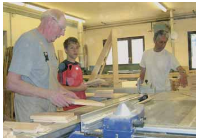
Bau der Nistkästen in der Schreinerei