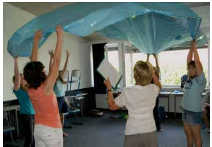
Proben für die Bühne