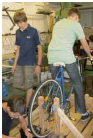
Das Kaffeefahrrad im Test