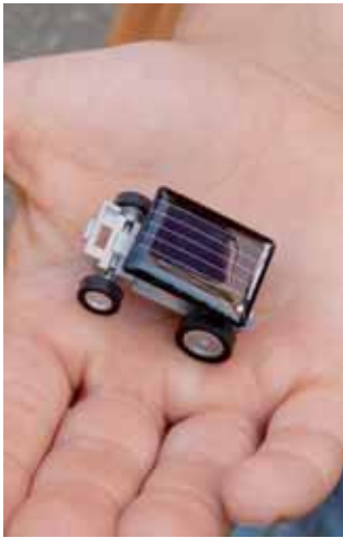
Kleinstes Solarauto der Welt