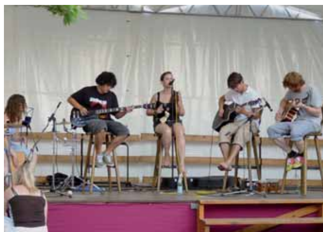
Ausklang mit Musik

Die Band Sofa-R, bestehend aus vier Altschülern und einer Schülerin der Klasse 12, bot einen stimmungsvollen Abschluss des Schulfestes.