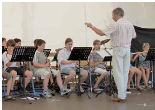
Die Bläserklasse beim Auftritt

Mitarbeiter und Eltern unterstützten das Hauswirtschaftsteam, um alle mit Speis und Trank zu versorgen. Der Hitze trotzend fand das Altschülerfußballspiel und ein Volleyballspiel „Schüler gegen Lehrer“ statt.