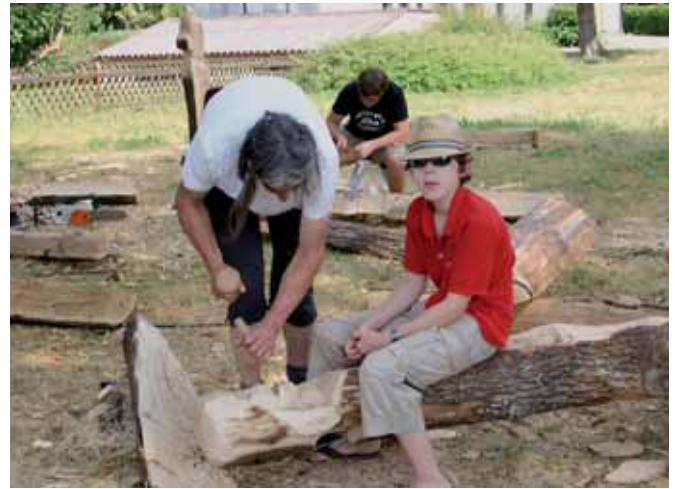
Künstler und Kunst im Freien